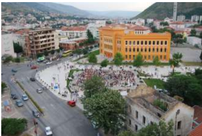
Mostarska gimnazija i Španjolski trg