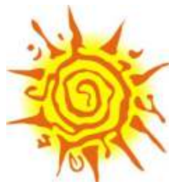
Turistička zajednica HNŽ/K