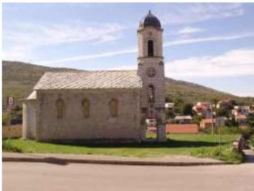
Pravoslavna crkva u Blagaju