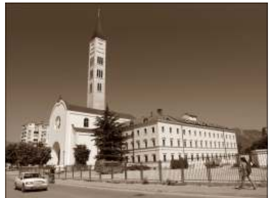
Franjevački samostan u Mostaru