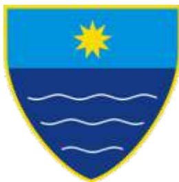
Ministarstvo poljoprivrede, šumarstva i vodoprivrede HNK/Ž