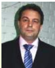
gosp. BAKIR MULAHALILOVIĆ Predsjednik SRS BiH

Svim takmičarima i gostima želim ugodan i prijatan boravak u Konjicu sa porukom da ostvarite što bolje sportske rezultate na takmičenju, a da grad Konjic, rijeku Neretvu i ljepote ovog područja ponese u svom srcu sa najljepšim utiscima.